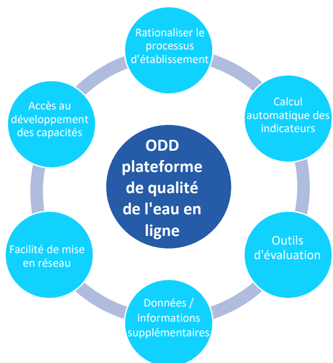
Figure 1 : Schéma des fonctions potentielles ODD plateforme de qualité de l'eau en ligne