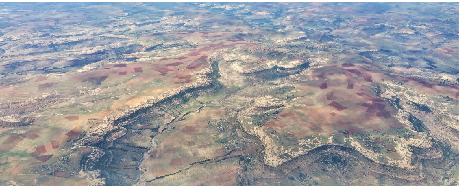
Photo : Les rivières du Lesotho vues d'en haut

Ce résumé exécutif et le rapport complet n'auraient pas été possibles sans les efforts des points focaux techniques de chaque pays et des membres de l'Alliance mondiale pour la qualité de l'eau qui ont apporté une contribution précieuse.